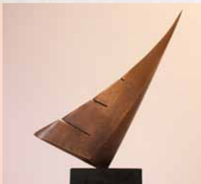
Chrysanthus Helmers: mit dem Wind