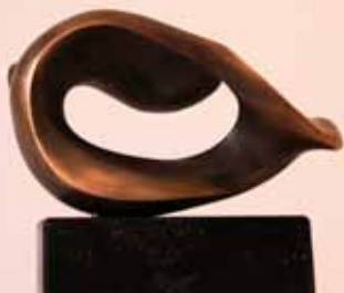
Gerhard Helmers: Meereslied